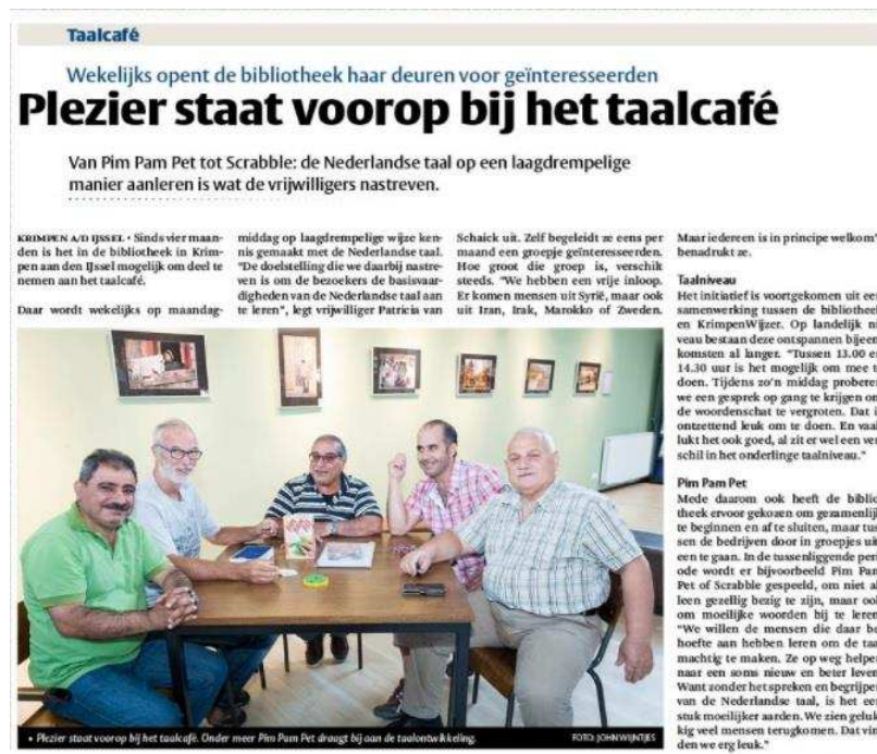
Taalcafé in de krant

Daarnaast leveren de samenwerking in het Taalnetwerk en de ondersteuning van de nieuwkomersgroep bij OBS Kortland belangrijke partners voor doorverwijzing op.