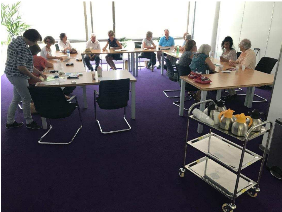
Workshop taal: klanken uitspreken